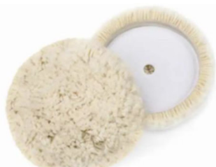
TL010 - Tampone per lucidatura a lato singolo in lana, spessore 40mm