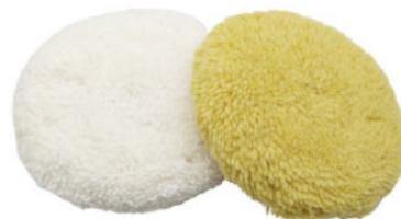
TL011 - Tampone per lucidatura in lana doppio lato, spessore 50mm